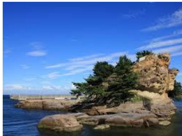
訪問予定/江島 伊弉諾神宮 先山先行寺 おのころ島他

国生みの聖地。伊弉諾尊と伊弉冉尊から始まったとされる神話で有名な淡路島。 神秘的なスポットや、絶景のロケーションはもちろん、海産物や玉葱をはじめとする地元の食材はとも魅力的です。 爽やかな初秋の風を感じながら、今注目の淡路島を満喫いたしましょう。 この日は、一粒万倍日で大安！たくさんのパワーをいただけるかも！