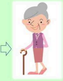
お一人暮らしで お元気な時