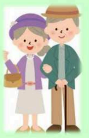
ご夫婦お二人 お元気なとき

定年退職後、趣味を満喫！ アップライブラリーで、それ ぞれ好きなカルチャーを楽し もう。