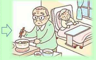
ご夫婦どちらかが 病気、介護状態のとき

..... 旅行にも行きたいから、庭 の水やりや、ポストの チェックはアップライ ブリーにお願いしまあす。